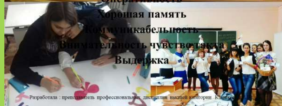
Разработала : преподаватель профессиональных дисциплин высшей категории Климова